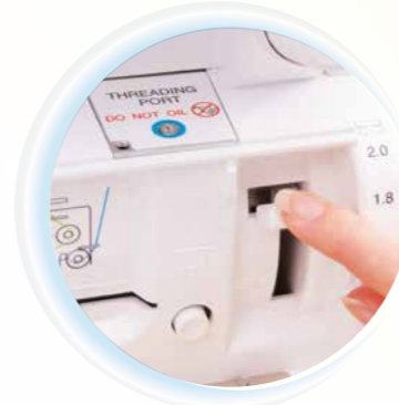
Jet-Air Threading™ System 1993 von baby lock entwickelt