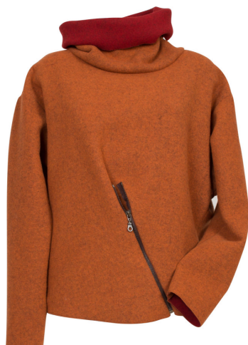
PULLOVER 602 422