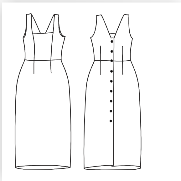
Figurbetontes Trägerkleid mit rückwärtiger Knopfleiste.